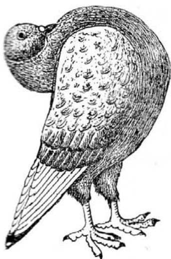
Fig. 149. — LE SLENKER.

Aspect général. — Sa tenue est celle du Hollekropper. Extrêmement nerveux comme le Queue-de-Paon, sa tête et son cou sont souvent agités de tremblements qui, aux moments de crise aiguë, gagnent tout le corps.